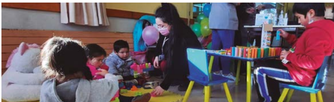
Los programas PPF participaron de actividades presenciales en las comunas donde están presentes.