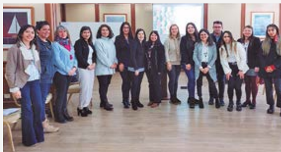
En el ámbito organizacional, una de las actividades concretadas fue un taller de liderazgo para directores y coordinadores de programas de ONG Coincide

En cuanto a la gestión de promoción, destacan la organización de seminarios, la participación en convenios con otros organismos de protección a la infancia, y la creación de productos como los videos testimoniales, a través de los programas de Familias de Acogida Especializada (FAE PRO) , Programas de Prevención Focalizada (PPF) y del programa Abriendo Caminos .