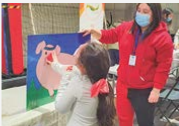
En Porvenir, Región de Magallanes, el programa PPF se sumó a las diversas actividades generadas a nivel municipal para festejar a las niñas y niños.