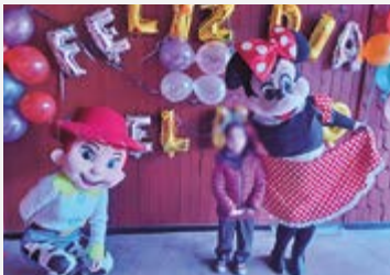
PPF Melipulli celebró después de dos años, el día del niño y la niña