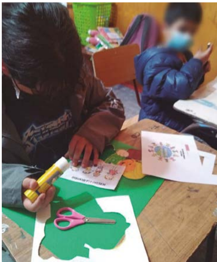
El 2022 se retomaron los talleres presenciales