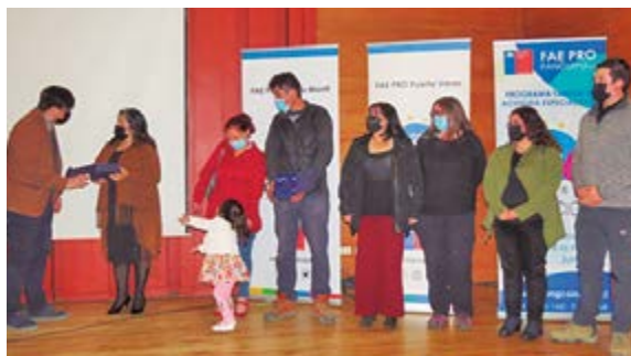
La entrega de reconocimientos a familias de acogida de Puerto Montt y Puerto Varas fue parte importante de la actividad