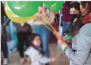
PPF Río Negro - Purranque fue invitado en junio de 2022, a la feria de la familia.