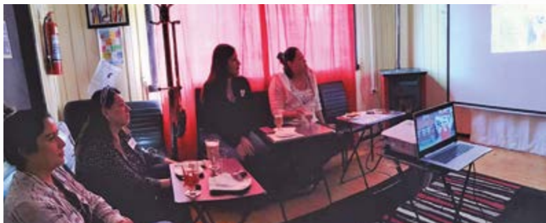
Los usuarios pudieron apreciar los testimonios en talleres y actividades de cada PPF