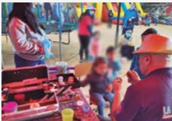
El PPF Río Negro Purranque tuvo juegos, pintacaritas y actividades recreativas para celebrar los derechos de niñas y niños, en agosto