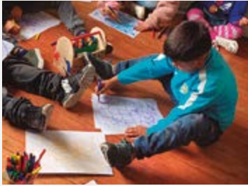
La pascua del conejo volvió a festejarse en las dependencias de los Programas de Prevención Focalizada .