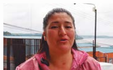
Familias de los programas PPF de ONG Coincide compartieron sus impresiones sobre el apoyo que brinda el proyecto

realizadas en cada PPF, proyectando el trabajo audiovisual en las oficinas como en otras instancias en terreno.